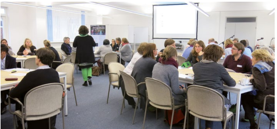
Engagierte Diskussionen im Rahmen des Kick-Off-Workshops

... Diversitätspolitik nachhaltig anzulegen, klare Verantwortungs- und Arbeitsstrukturen zu schaffen, bestehende Kräfte zu bündeln und mit entsprechenden Ressourcen zu hinterlegen.