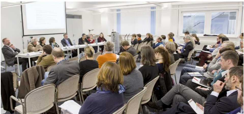
Kick-Off-Veranstaltung zum Diversity Audit

... Individuallösungen (Einzelfallentscheidungen) noch stärker mit strukturellen Lösungen zu kombinieren,