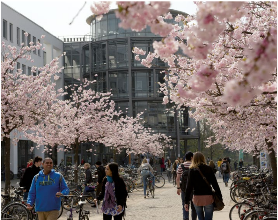
Aufbruch – Kirschblüte auf dem Campus

pen. Querschnittsaufgabe bedeutet, dass nicht nur einzelne Beauftragte und ausgebildete Fachkräfte, sondern alle Mitglieder und Angehörigen der Universität aufgefordert sind, alle Strukturen und Prozesse in allen Handlungsfeldern – wie Forschung, Studium, Lehre, Wissenstransfer und Wissenschaftsmanagement – diversitätsgerecht zu gestalten.